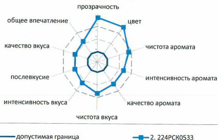
Рис.3.1. Сравнение качества образцов вина тихого (дегустация 23.09.2021 сет 3)

Протокол не может быть воспроизведен полностью или частично без письменного разрешения Руководителя Сенсорной лаборатории.