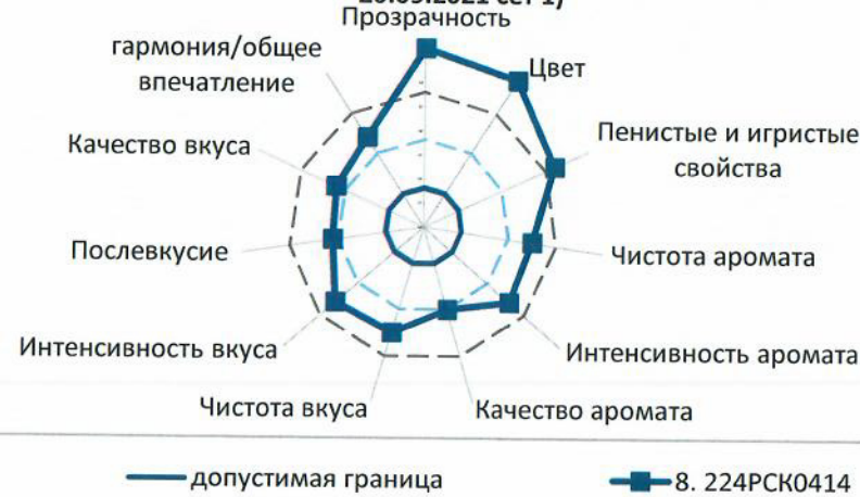
Рис. 1.2. Сравнение качества образцов вина игристого (дегустация 20.09.2021 сет 1)

Протокол не может быть воспроизведен полностью или частично без письменного разрешения Руководителя Сенсорной лаборатории.