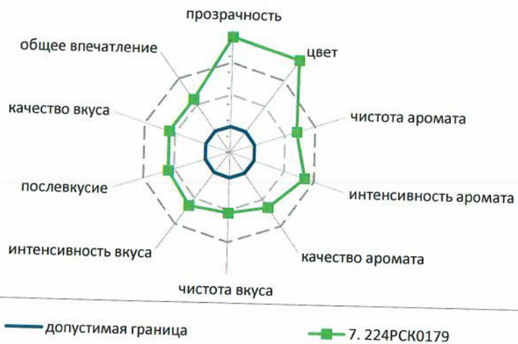
Рис.4.2. Сравнение качества образцов вина тихого (дегустация 13.09.2021 сет 4)

Протокол не может быть воспроизведен полностью или частично без письменного разрешения Руководителя Сенсорной лаборатории. Полученные результаты относятся к предоставленным Заказчиком образцам. Конец выписки из протокола.