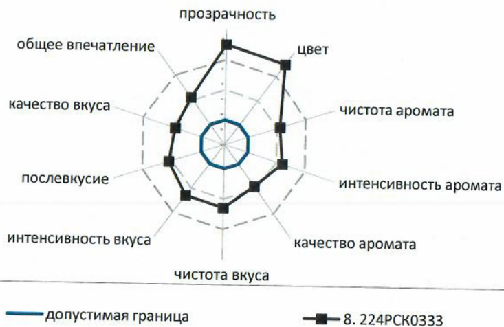
Рис.4.2. Сравнение качества образцов вина тихого (дегустация 16.09.2021 сет 4)

Протокол не может быть воспроизведен полностью или частично без письменного разрешения Руководителя Сенсорной лаборатории.