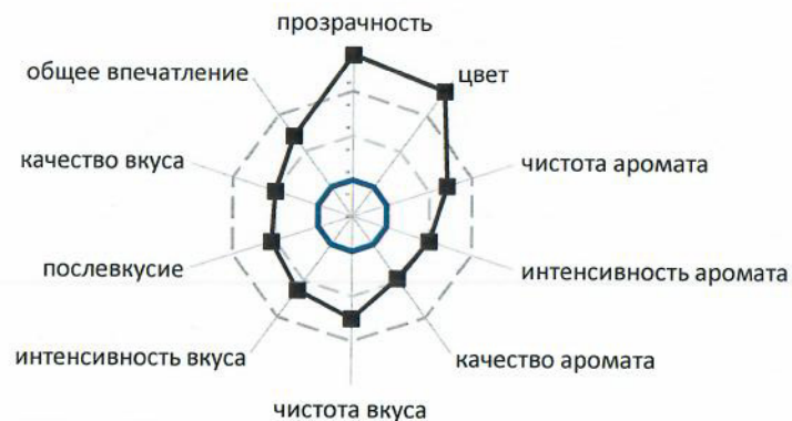
Рис.3.2. Сравнение качества образцов вина тихого (дегустация 21.09.2021 сет 3)