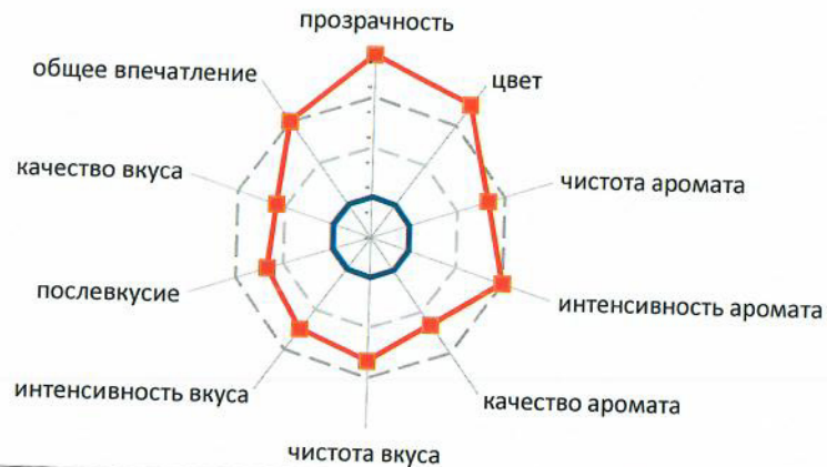
Рис.1.2. Сравнение качества образцов вина тихого (дегустация 27.09.2021 сет 1)