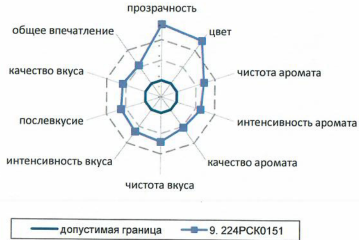
Рис.3.3. Сравнение качества образцов вина тихого (дегустиция 10.09.2021 сет 3)

Протокол не может быть воспроизведен полностью или частично без письменного разрешения Руководителя Сенсорной лаборатории.