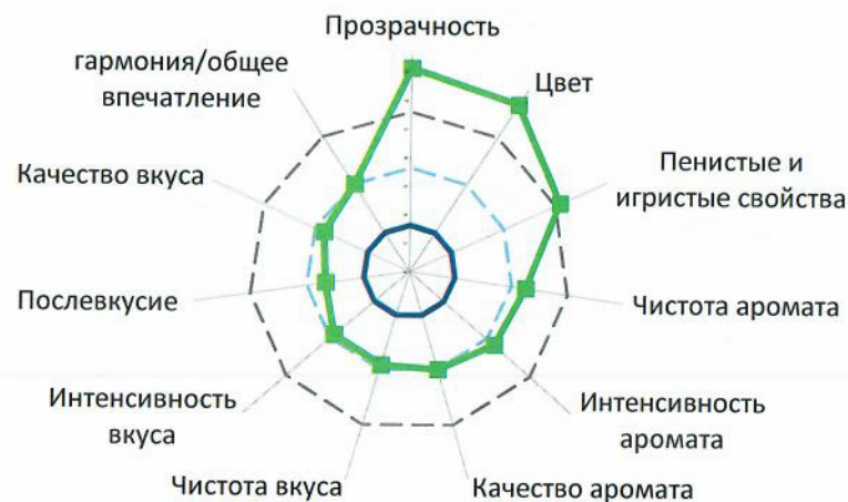
Рис. 1.2. Сравнение качества образцов вина игристого (дегустиция 21.09.2021 сет 1)