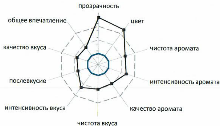
Рис.2.3. Сравнение качества образцов вина тихого (дегустиация 16.09.2021 сет 2)