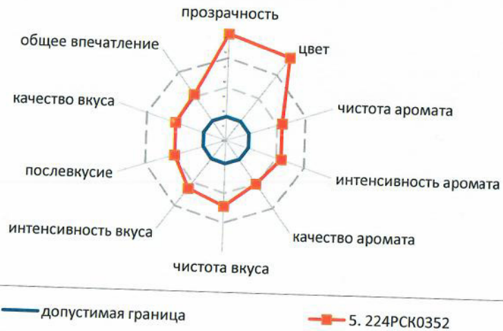
Рис.2.2. Сравнение качества образцов вина тихого (дегустация 17.09.2021 сет 2)

Протокол не может быть воспроизведен полностью или частично без письменного разрешения Руководителя Сенсорной лаборатории. Полученные результаты относятся к предоставленным Заказчиком образцам. Конец выписки из протокола.