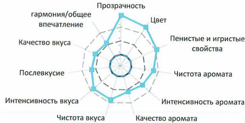
Рис.1.1. Сравнение качества образцов вина игристого (дегустиация 22.09.2021 сет 1)