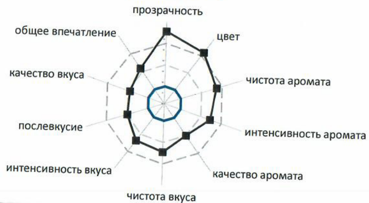
Рис.3.1. Сравнение качества образцов вина тихого (дегустация 24.09.2021 сет 3)