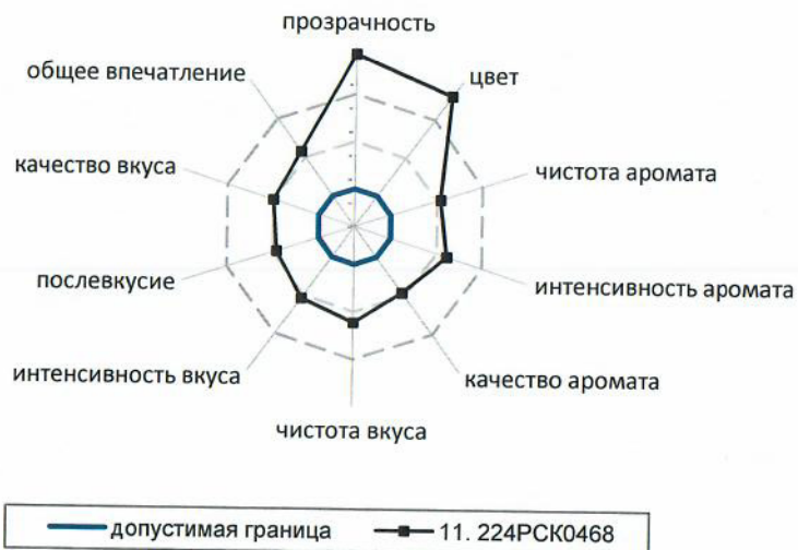
Рис.3.3. Сравнение качества образцов вина тихого (дегустиация 22.09.2021 сет 3)

Протокол не может быть воспроизведен полностью или частично без письменного разрешения Руководителя Сенсорной лаборатории.