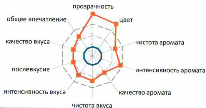
Рис.4.2. Сравнение качества образцов вина тихого (дегустация 10.09.2021 сет 4)