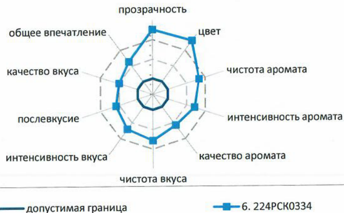
Рис.3.2. Сравнение качества образцов вина тихого (дегустация 16.09.2021 сет 3)

Протокол не может быть воспроизведен полностью или частично без письменного разрешения Руководителя Сенсорной лаборатории.