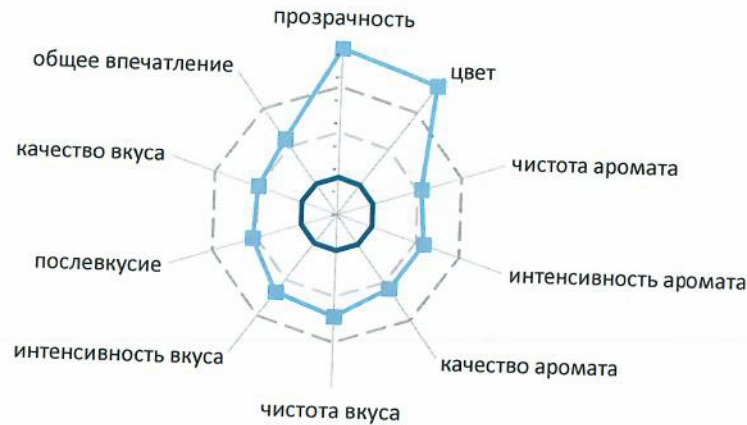
Рис.3.3. Сравнение качества образцов вина тихого (дегустиция 17.09.2021 сет 3)