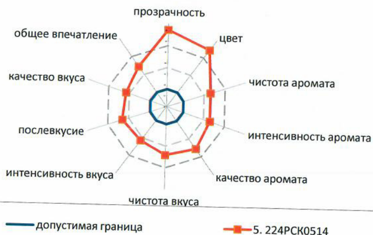
Рис.2.2. Сравнение качества образцов вина тихого (дегустация 27.09.2021 сет 2)

Протокол не может быть воспроизведен полностью или частично без письменного разрешения Руководителя Сенсорной лаборатории. Полученные результаты относятся к предоставленным Заказчиком образцам. Конец выписки из протокола.