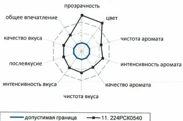
Рис.3.3. Сравнение качества образцов вина тихого (дегустация 23.09.2021 сет 3)

Протокол не может быть воспроизведен полностью или частично без письменного разрешения Руководителя Сенсорной лаборатории.