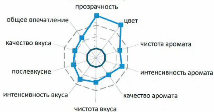
Рис.4.1. Сравнение качества образцов вина тихого (дегустация 10.09.2021 сет 4)