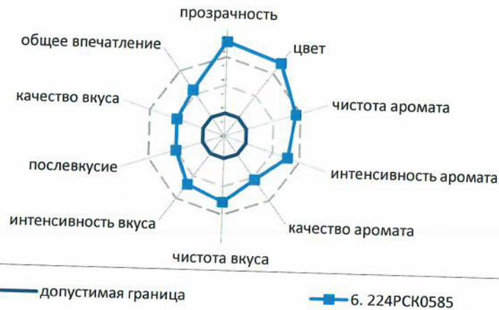
Рис.3.2. Сравнение качества образцов вина тихого (дегустация 24.09.2021 сет 3)

Протокол не может быть воспроизведен полностью или частично без письменного разрешения Руководителя Сенсорной лаборатории. Полученные результаты относятся к предоставленным Заказчиком образцам. Конец выписки из протокола.