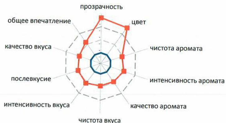
Рис.3.3. Сравнение качества образцов вина тихого (дегустиация 15.09.2021 сет 3)