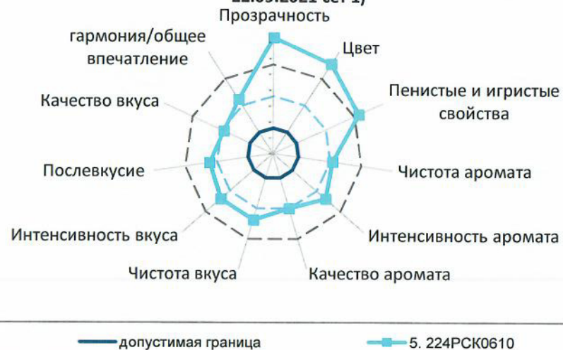
Рис. 1.2. Сравнение качества образцов вина игристого (дегустиация 22.09.2021 сет 1)

Протокол не может быть воспроизведен полностью или частично без письменного разрешения Руководителя Сенсорной лаборатории.