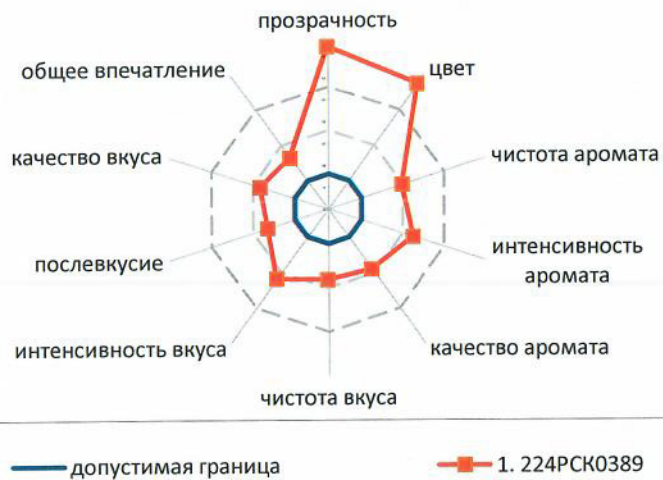
Рис.3.1. Сравнение качества образцов вина тихого (дегустация 20.09.2021 сет 3)

Протокол не может быть воспроизведен полностью или частично без письменного разрешения Руководителя Сенсорной лаборатории. Полученные результаты относятся к предоставленным Заказчиком образцам. Конец выписки из протокола.