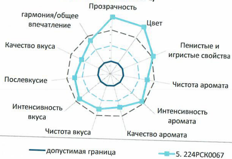
Рис. 2.2. Сравнение качества образцов вина игристого (дегустация 08.09.2021сет 2)

Протокол не может быть воспроизведен полностью или частично без письменного разрешения Руководителя Сенсорной лаборатории. Полученные результаты относятся к предоставленным Заказчиком образцам. Конец выписки из протокола.