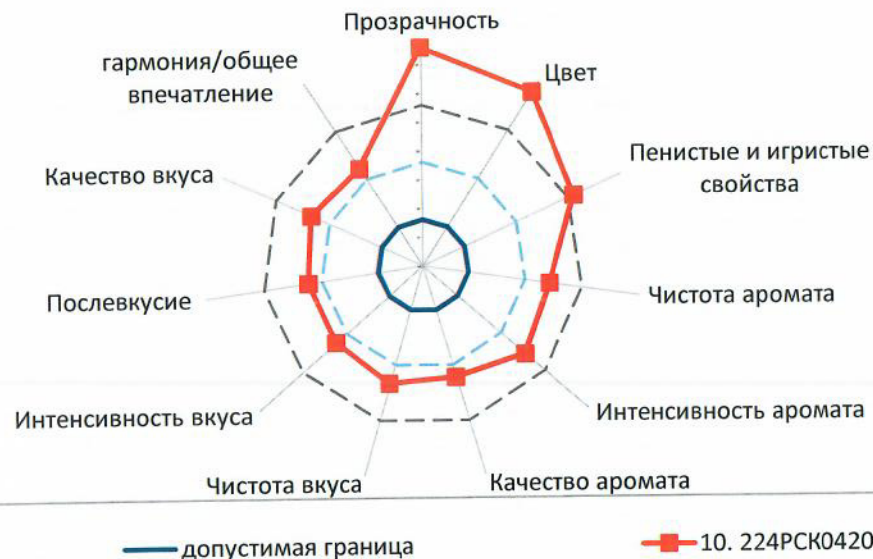
Рис. 2.3. Сравнение качества образцов вина игристого (дегустиция 20.09.2021 2сет)

Протокол не может быть воспроизведен полностью или частично без письменного разрешения Руководителя Сенсорной лаборатории. Полученные результаты относятся к предоставленным Заказчиком образцам. Конец выписки из протокола.