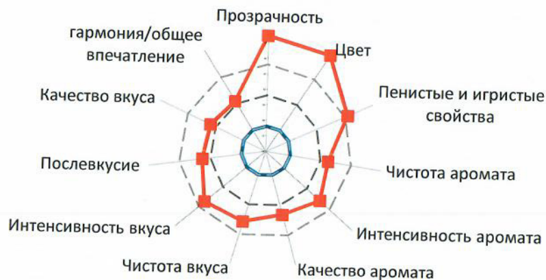
Рис.1.1. Сравнение качества образцов вина игристого (дегустиация 10.09.2021 сет 1)

Протокол не может быть воспроизведен полностью или частично без письменного разрешения Руководителя Сенсорной лаборатории. Полученные результаты относятся к предоставленным Заказчиком образцам. Конец выписки из протокола.