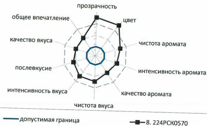
Рис.3.2. Сравнение качества образцов вина тихого (дегустация 24.09.2021 сет 3)

Протокол не может быть воспроизведен полностью или частично без письменного разрешения Руководителя Сенсорной лаборатории. Полученные результаты относятся к предоставленным Заказчиком образцам. Конец выписки из протокола.