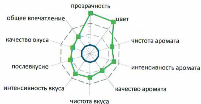
Рис.4.1. Сравнение качества образцов вина тихого (дегустация 10.09.2021 сет 4)