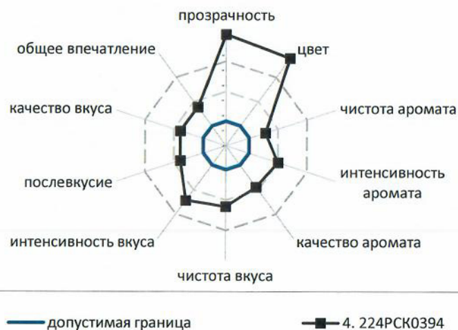
Рис.3.1. Сравнение качества образцов вина тихого (дегустация 20.09.2021 сет 3)

Протокол не может быть воспроизведен полностью или частично без письменного разрешения Руководителя Сенсорной лаборатории.