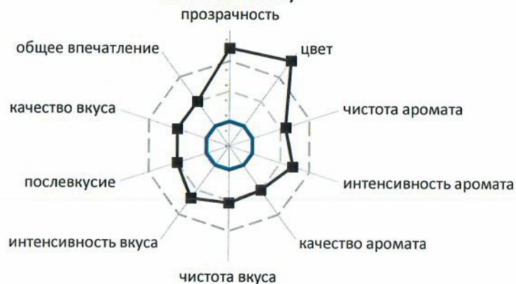
Рис.2.2. Сравнение качества образцов вина тихого (дегустация 16.09.2021 сет 2)