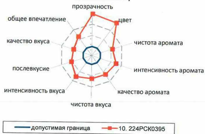
Рис.3.3. Сравнение качества образцов вина тихого (дегустация 20.09.2021 сет 3)

Протокол не может быть воспроизведен полностью или частично без письменного разрешения Руководителя Сенсорной лаборатории.