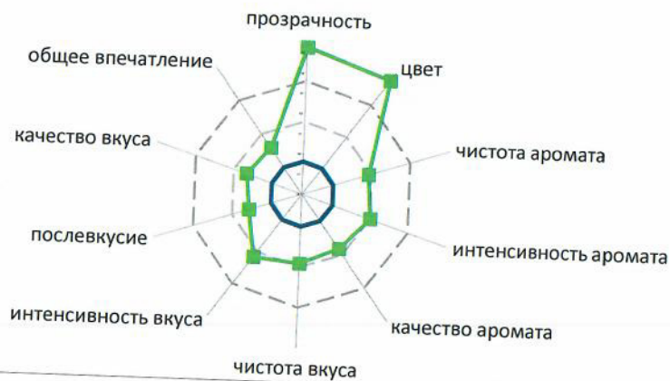
Рис.4.2. Сравнение качества образцов вина тихого (дегустация 08.09.2021 сет 4)