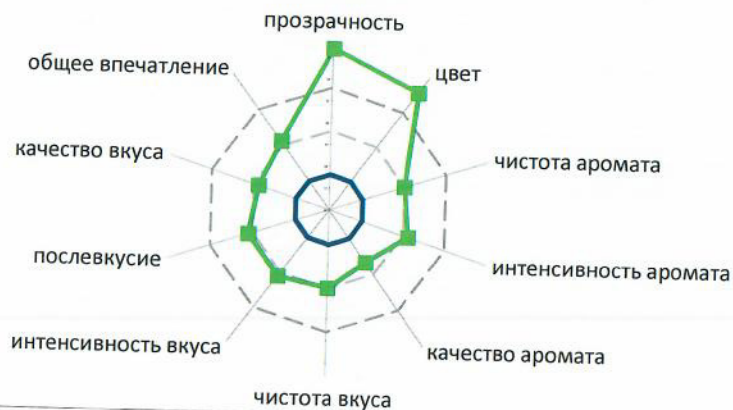
Рис.3.4. Сравнение качества образцов вина тихого (дегустация 07.09.2021 сет 3)