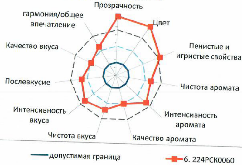
Рис. 2.2. Сравнение качества образцов вина игристого (дегустиация 08.09.2021сет 2)

Протокол не может быть воспроизведен полностью или частично без письменного разрешения Руководителя Сенсорной лаборатории. Полученные результаты относятся к предоставленным Заказчиком образцам. Конец выписки из протокола.