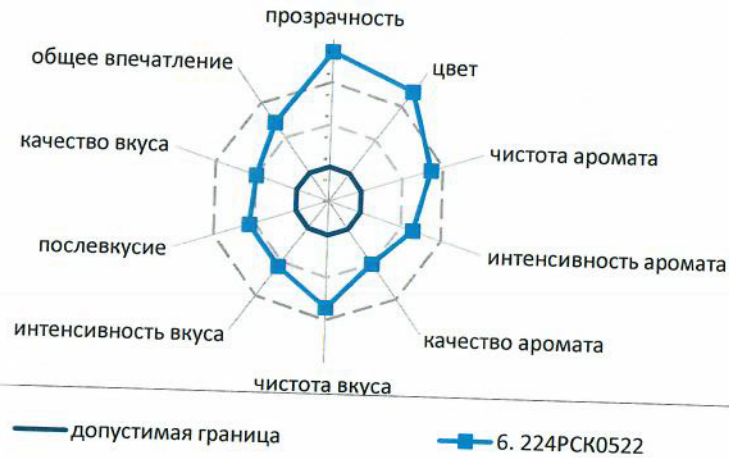
Рис.2.2. Сравнение качества образцов вина тихого (дегустация 27.09.2021 сет 2)

Протокол не может быть воспроизведен полностью или частично без письменного разрешения Руководителя Сенсорной лаборатории. Полученные результаты относятся к предоставленным Заказчиком образцам. Конец выписки из протокола.