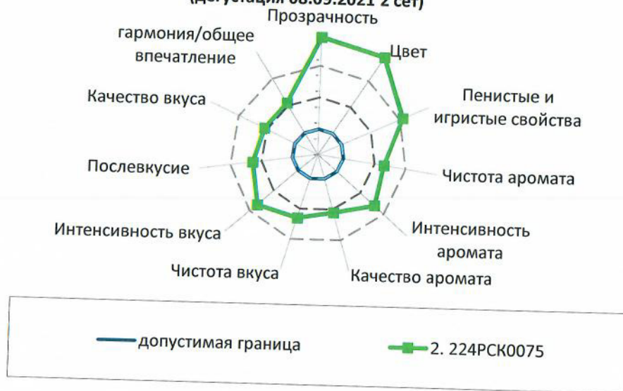
Рис.2.1. Сравнение качества образцов вина игристого (дегустиация 08.09.2021 2 сет)

Протокол не может быть воспроизведен полностью или частично без письменного разрешения Руководителя Сенсорной лаборатории. Полученные результаты относятся к предоставленным Заказчиком образцам.