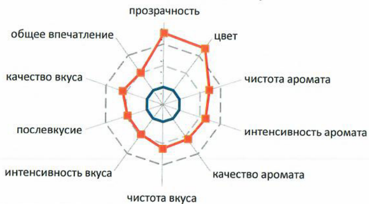
Рис.2.1. Сравнение качества образцов вина тихого (дегустация 16.09.2021 сет 2)