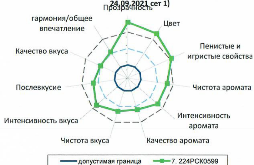
Рис. 1.2. Сравнение качества образцов вина игристого (дегустиация 24.09.2021 сет 1)

Протокол не может быть воспроизведен полностью или частично без письменного разрешения Руководителя Сенсорной лаборатории.