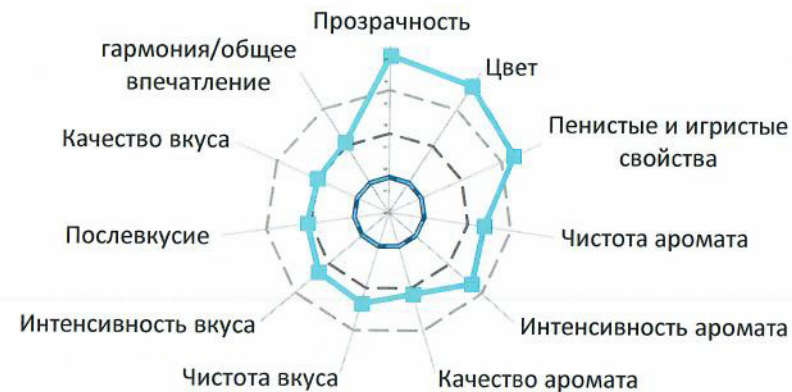
Рис.1.1. Сравнение качества образцов вина игристого (дегустация 21.09.2021 сет 1)