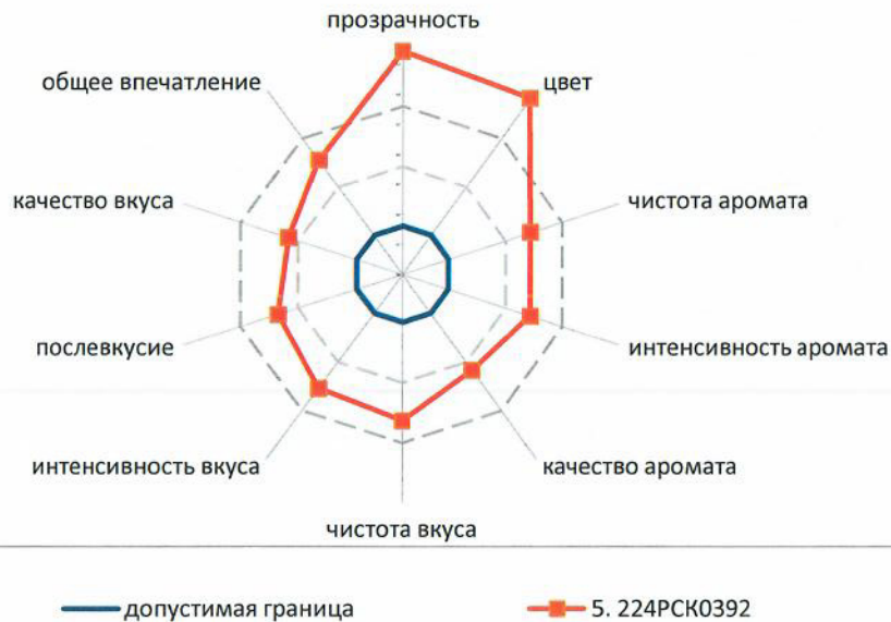
Рис.4.2. Сравнение качества образцов вина тихого (дегустиция 20.09.2021 сет 4)

Протокол не может быть воспроизведен полностью или частично без письменного разрешения Руководителя Сенсорной лаборатории. Полученные результаты относятся к предоставленным Заказчиком образцам. Конец выписки из протокола.