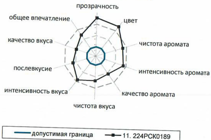
Рис.3.3. Сравнение качества образцов вина тихого (дегустиация 13.09.2021 сет 3)

Протокол не может быть воспроизведен полностью или частично без письменного разрешения Руководителя Сенсорной лаборатории. Полученные результаты относятся к предоставленным Заказчиком образцам. Конец выписки из протокола.