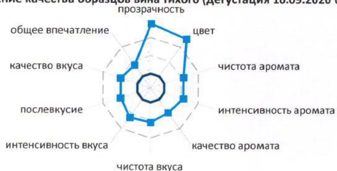
Рис.1.1. Сравнение качества образцов вина тихого (дегустация 16.09.2020 сет 1)