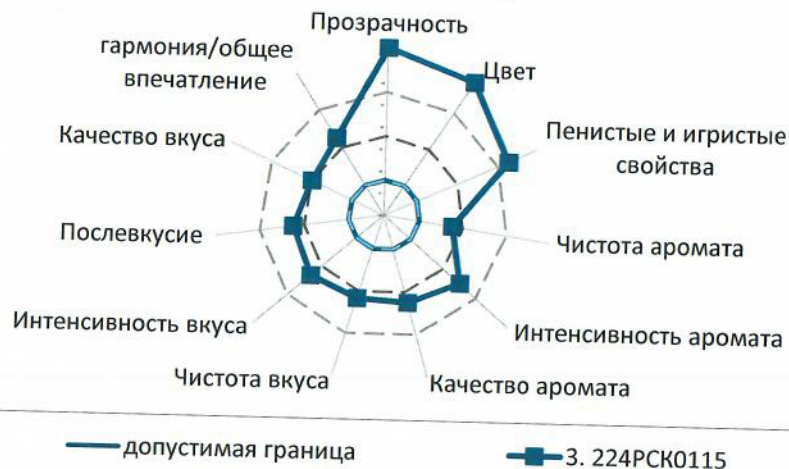
Рис.1.1. Сравнение качества образцов вина игристого (дегустиация 09.09.2021 1 сет)

Протокол не может быть воспроизведен полностью или частично без письменного разрешения Руководителя Сенсорной лаборатории. Полученные результаты относятся к предоставленным Заказчиком образцам. Конец выписки из протокола