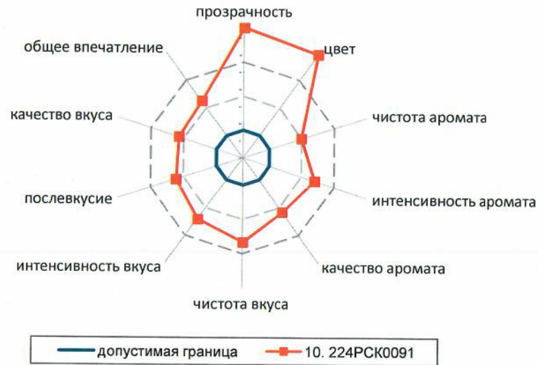
Рис.2.3. Сравнение качества образцов вина тихого (дегустиция 09.09.2021 сет 2)

Протокол не может быть воспроизведен полностью или частично без письменного разрешения Руководителя Сенсорной лаборатории.