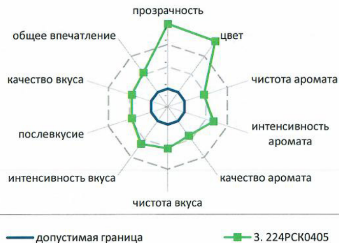
Рис.3.1. Сравнение качества образцов вина тихого (дегустация 20.09.2021 сет 3)

Протокол не может быть воспроизведен полностью или частично без письменного разрешения Руководителя Сенсорной лаборатории.