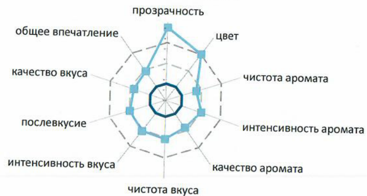
Рис.4.3. Сравнение качества образцов вина тихого (дегустация 13.09.2021 сет 4)