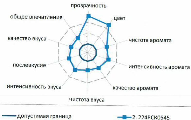
Рис.2.1. Сравнение качества образцов вина тихого (дегустиация 23.09.2021 сет 2)

Протокол не может быть воспроизведен полностью или частично без письменного разрешения Руководителя Сенсорной лаборатории. Полученные результаты относятся к предоставленным Заказчиком образцам. Конец выписки из протокола.