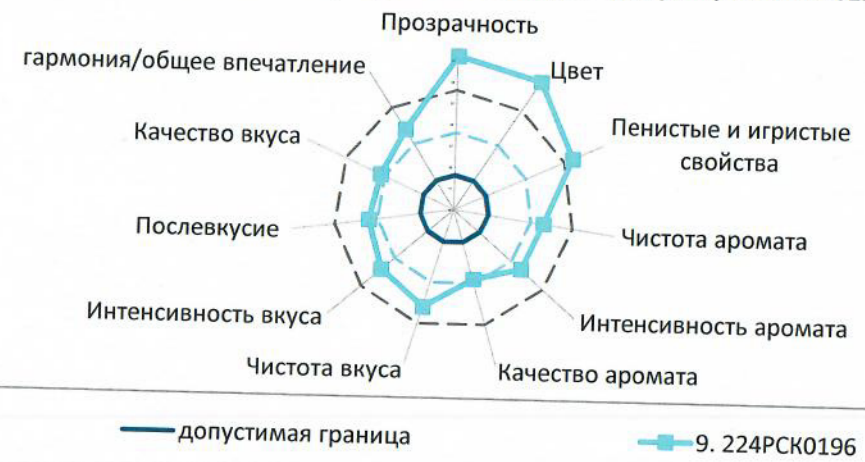
Рис. 1.3. Сравнение качества образцов вина игристого (дегустация 13.09.2021 1сет)

Протокол не может быть воспроизведен полностью или частично без письменного разрешения Руководителя Сенсорной лаборатории. Полученные результаты относятся к предоставленным Заказчиком образцам. Конец выписки из протокола.