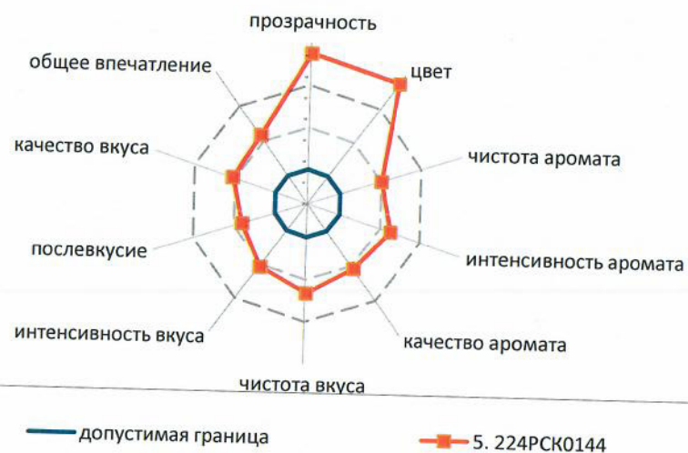
Рис.2.2. Сравнение качества образцов вина тихого (дегустиация 10.09.2021 сет 2)

Протокол не может быть воспроизведен полностью или частично без письменного разрешения Руководителя Сенсорной лаборатории. Полученные результаты относятся к предоставленным Заказчиком образцам. Конец выписки из протокола.