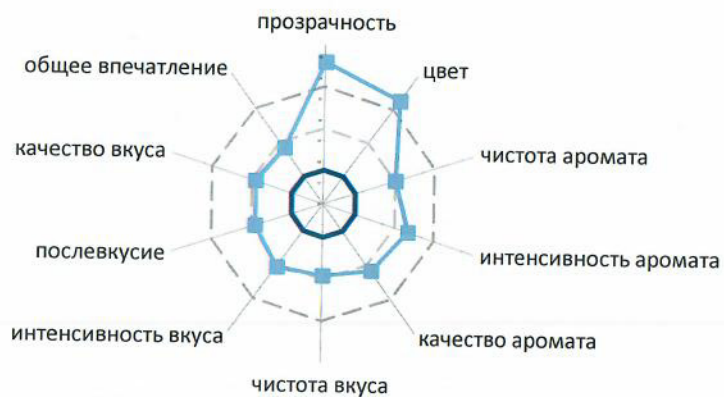
Рис.2.3. Сравнение качества образцов вина тихого (дегустация 23.09.2021 сет 2)